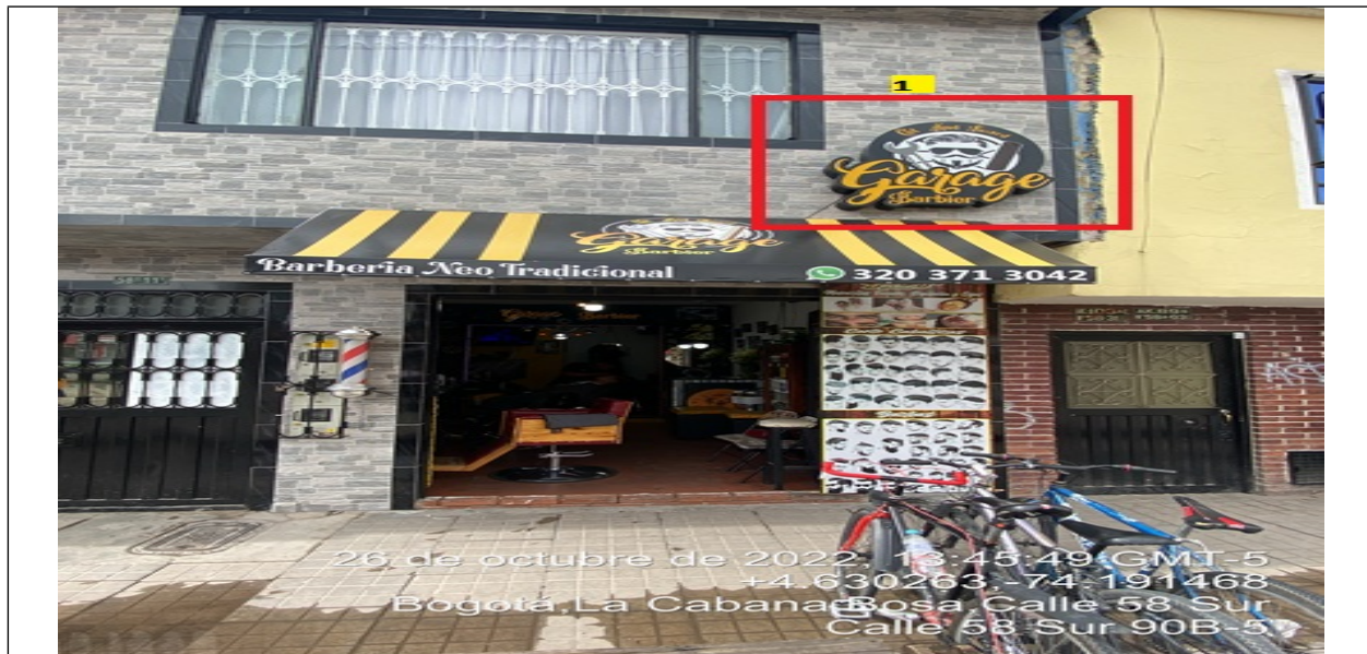
En la cual se evidencia un (1) elemento tipo aviso en fachada ubicado en antepecho de segundo piso perteneciente al establecimiento comercial denominado GARAGE CUT AND BEARD , el cual al momento de la visita se encontraba instalado sin el registro ante la SDA.