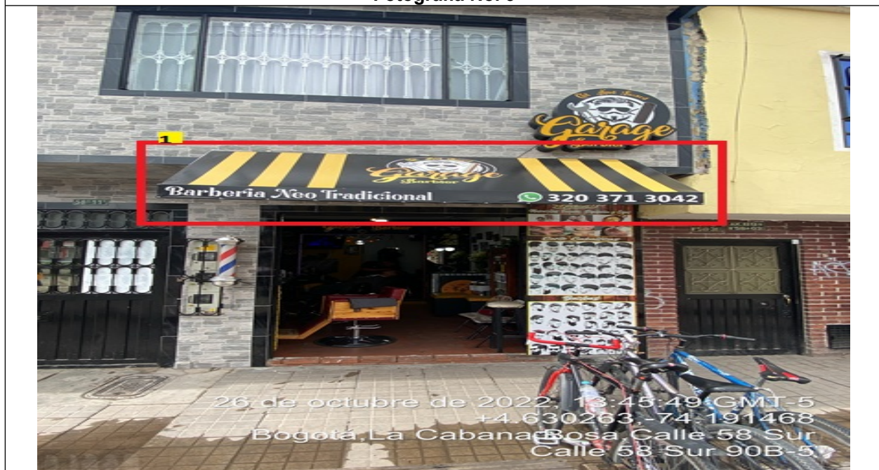
En la cual se evidencia un elemento (carpa) la cual contine publicidad incorporada perteneciente al establecimiento comercial denominado GARAGE CUT AND BEARD .